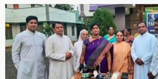
De opening van de naaiateliers

Het Missiebureau Roermond heeft onlangs een rapportage van dit project ontvangen; een document dat de voortgang en de positieve impact van deze centra op de gemeenschap gedetailleerd weergeeft. Dit rapport is een getuigenis van de mogelijkheden die ontstaan wanneer we investeren in het onbenutte potentieel binnen dergelijke gemeenschappen. De naaiateliers zijn een levend voorbeeld van hoe gerichte steun en opleiding een fundamentele verandering kunnen teweegbrengen in het leven van velen.