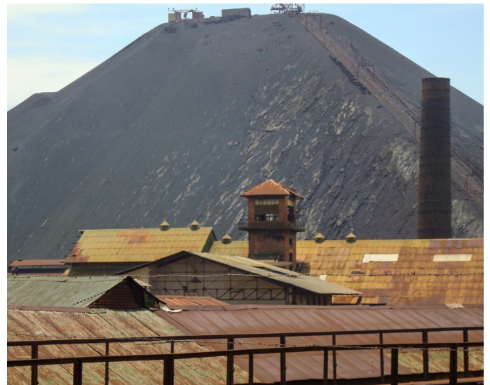
Kopermijn in Congo

In Congo, een land dat rijk is aan natuurlijke hulpbronnen als coltan en kobalt, treedt een paradox op. Deze mineralen zijn cruciaal voor de technologische vooruitgang in het Westen, maar hun exploitatie leidt tot ernstige sociale en ecologische problemen. Paus Franciscus herinnert ons in zijn brief 'Laudate Deum' eraan dat onze omgang met de natuur en haar hulpbronnen diep verweven is met de waardigheid van het menselijk leven. Hij spreekt over klimaatverandering als een structurele zonde, een reflectie op de onrechtvaardigheden die voortkomen uit onze huidige economische en technologische modellen.