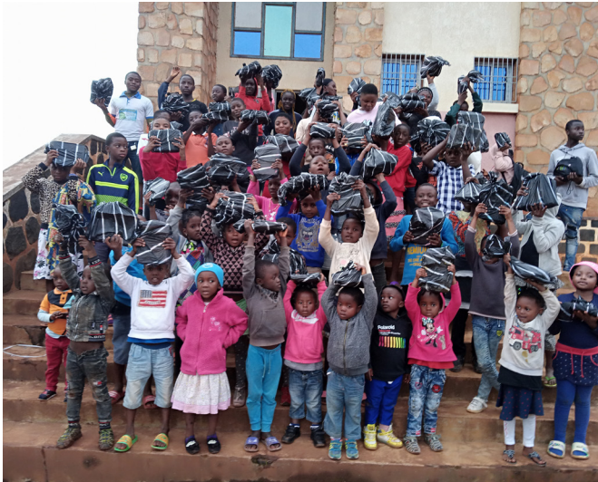
De kinderen laten trots hun schoolmaterialenpakket zien