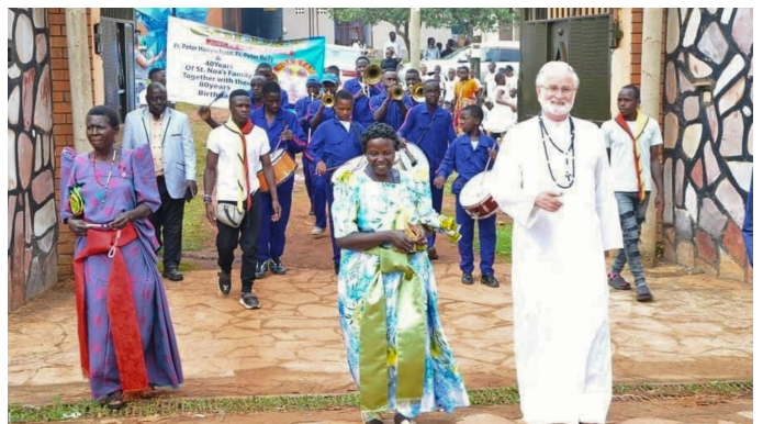
Processie door het dorp

Honderden gasten verzamelden zich om het jubileum samen te vieren. De festiviteiten begonnen met een feestelijke processie voorafgaand aan de eucharistieviering.