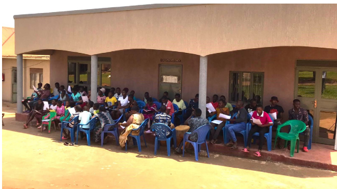
De liedjes voor het jubileumfeest worden geïmproviseerd in de schaduw van het strak geschilderde bezoekershuis

Het succes van deze jubileumviering was te danken aan de inzet van velen die hun tijd, energie en middelen hebben ingezet om deze dag onvergetelijk te maken. Het Missiebureau wil haar oprechte dankbaarheid uitspreken aan alle donateurs die hebben bijgedragen aan het jubileumcadeau, waarmee een deel van de gebouwen van St. Noa's Family kon worden opgeknapt. Ook namens de gehele gemeenschap van St. Noa's Family, heel hartelijk dank!