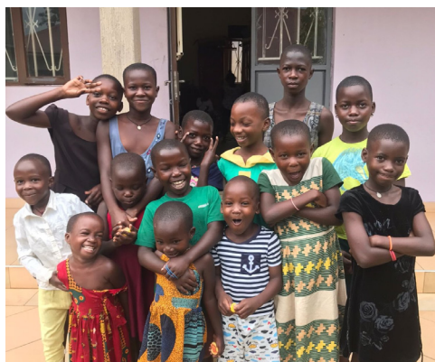
Ook de kinderen genoten van deze feestdag

Het succes van deze jubileumviering was te danken aan de inzet van velen die hun tijd, energie en middelen hebben ingezet om deze dag onvergetelijk te maken. Het Missiebureau wil haar oprechte dankbaarheid uitspreken aan alle donateurs die hebben bijgedragen aan het jubileumcadeau, waarmee een deel van de gebouwen van St. Noa's Family kon worden opgeknapt. Ook namens de gehele gemeenschap van St. Noa's Family, heel hartelijk dank!