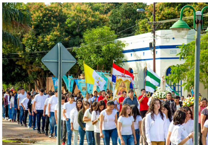
Vele jongeren namen deel aan de processie.

Kerk liefhebben en de noodzaak van begeleiding en evangelisatie begrijpen.