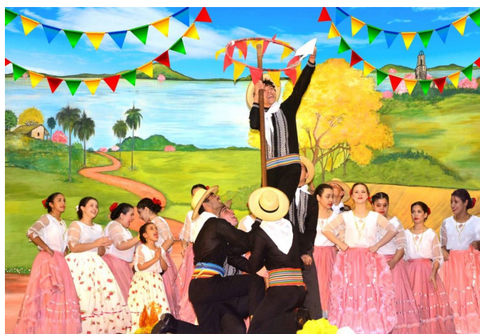
Het feest van San Juan wordt door jong en oud gevierd.

De betrokkenheid van velen in de parochie is het resultaat van het toegewijde werk van ons pastorale team, dat gedurende vele jaren obstakels heeft overwonnen om een hechte kerkgemeenschap op te bouwen die het christelijk leven belichaamt via het werk in de parochie.