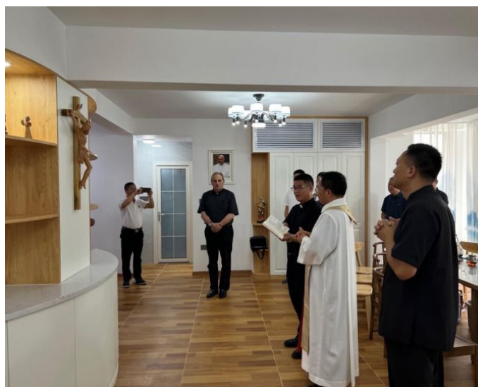
Het gemeenschapshuis van de Salvatorianen wordt ingezegend

Het doel van dit project was helder: het vestigen van een gemeenschappelijke woonruimte voor de Chinese Salvatorianen, een basis van waaruit roepingen geanimeerd en de eerste basisopleiding georganiseerd konden worden. Het markeerde ook een historische mijlpaal, precies honderd jaar na de